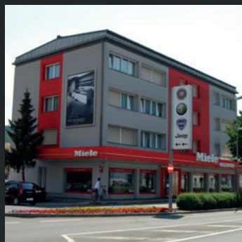
Miele Center Olsacher Spittal/Drau