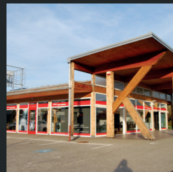
Miele Center Preissegger Wolfsberg