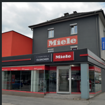
Miele Center Olsacher Villach