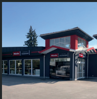
Miele Center Preissegger Klagenfurt